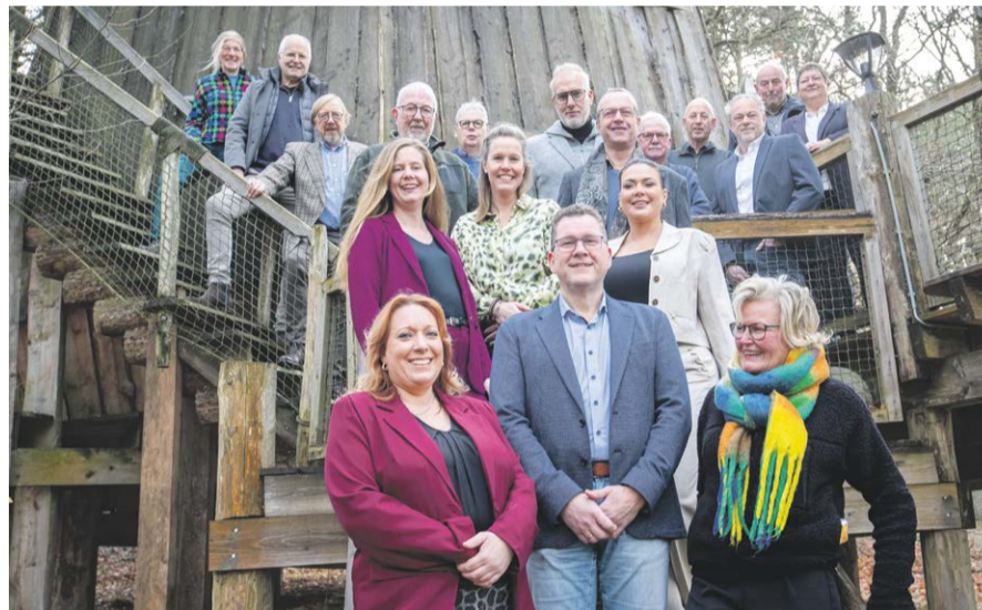
Gemeentebelangen, Samen Blijven Doen

Wij geloven in een gemeente waar het prettig wonen, werken en leven is, met oog voor elkaar en voor onze omgeving.